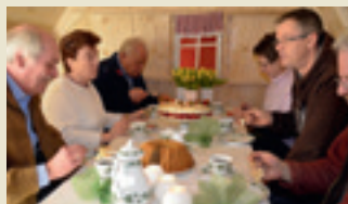
6 personnes peuvent s'y installer confortablement.