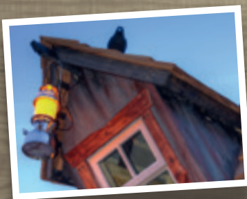
Art. n° 600324 - Lucarne avec fenêtre double vitrage (élément non peint, couverture bardeaux red cedar en sus) - Accessoires non inclus -