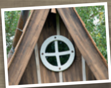
Art. n° 600325 - Fenêtre ronde "le coup d'œil" (fenêtre fournie non peinte)