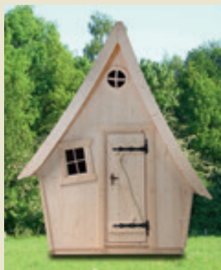
Modèle de base Art. n° 600339

Pour que l'assemblage de nos produits reste un réel plaisir, 95 % de nos bois sont prédécoupés en usine. Nous vous garantissons une qualité irréprochable grâce à l'utilisation de la technologie de découpe numérique CNC. Tous nos produits sont livrés avec la visserie adéquate et accompagnés d'une notice de montage qualitative et détaillée. Et si tel est votre souhait, nous pouvons non seulement vous proposer la mise en peinture mais également le montage de votre "Casa Mirabilia"