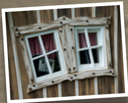
Art. n° 600449 - Fenêtre double (élément non peint)